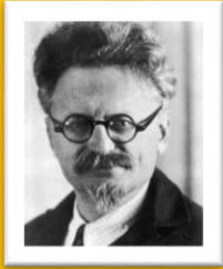
Lev Trotskij Modeskribent, Murvel och Marxsympatisör